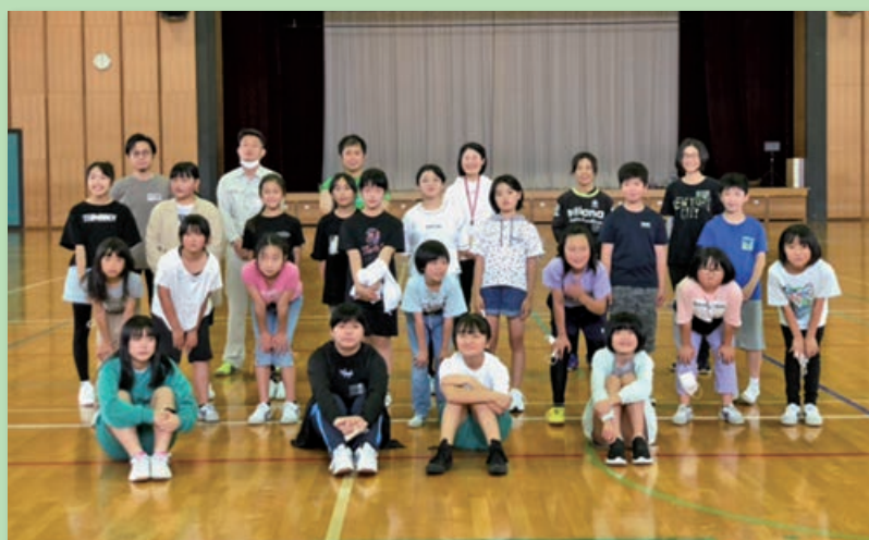
いきいきアドベンチャークラブ 1回目