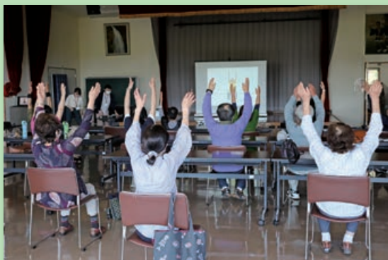
5/25 1回目の様子 ・体力測定 ・いきいき百歳体操