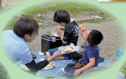
親子DE楽笑くらぶ 1回目