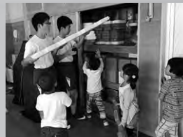
かがり火スタッフ→