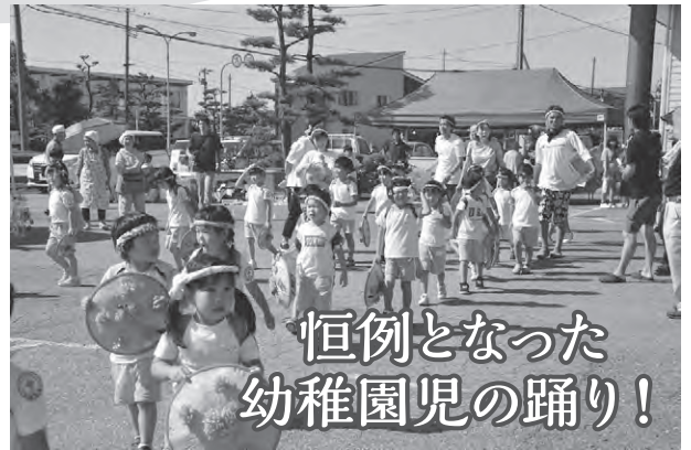
恒例となった 幼稚園児の踊り!