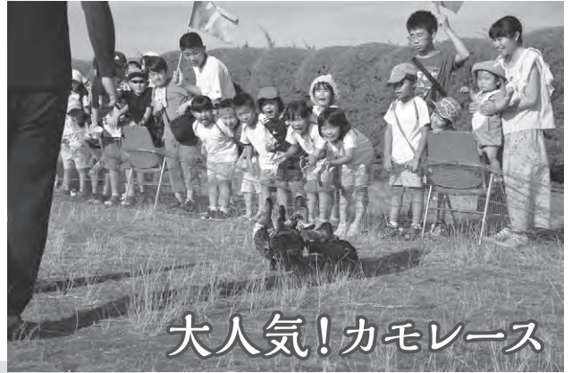
大人気!カモレース