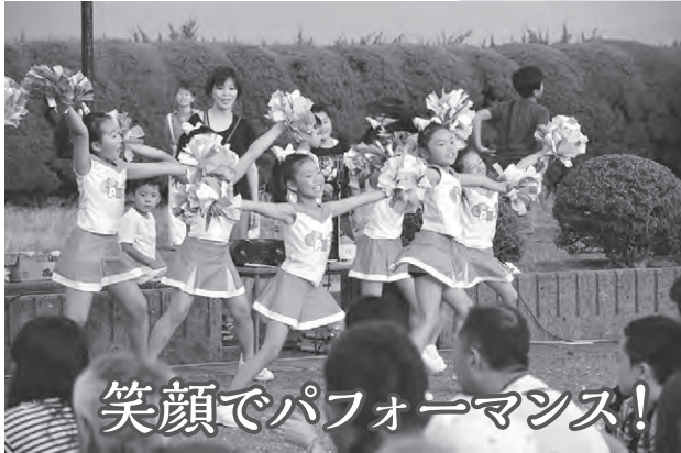
笑顔でパフォーマンス!